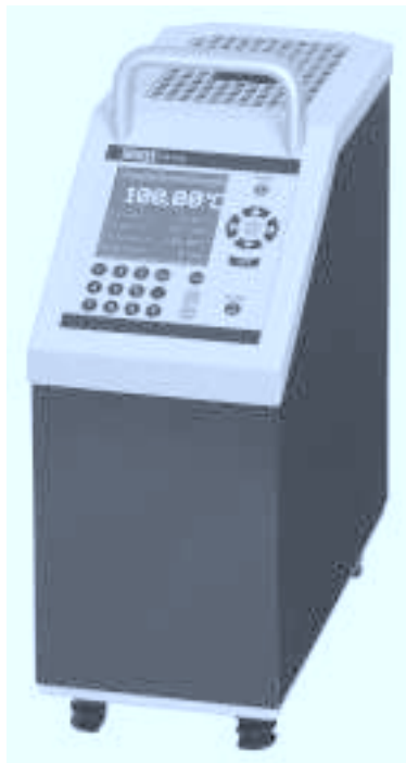
Сухоблочный калибратор температуры CTD 9300