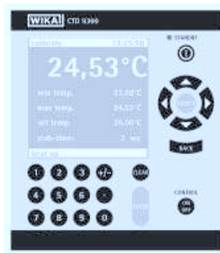
Меню измерений и калибровки

С измерительным прибором, который может встраиваться в существующие калибраторы, Pt 100, термопары и 4-20 мА токовый сигнал, можно измерять и переводить в температуры, также сличать с внешними термометрами сличения. Автоматическая калибровка возможна при использовании PC/ноутбук и калибровочного оборудования.