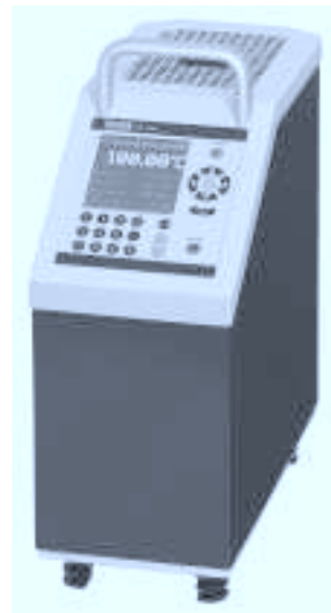
Сухоблочный термостат CTD 9300