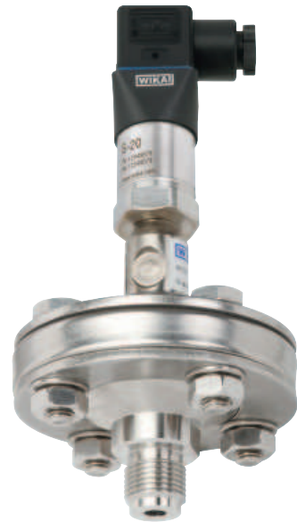
Система мембранных разделителей, модель DSS10T