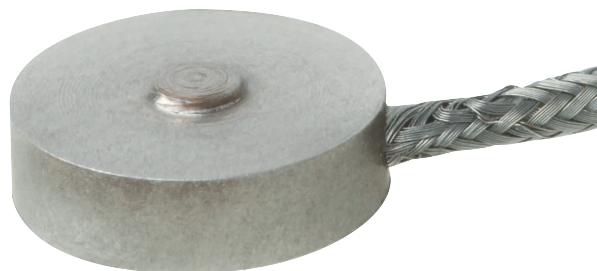
Миниатюрный компрессионный датчик силы, модель F1222