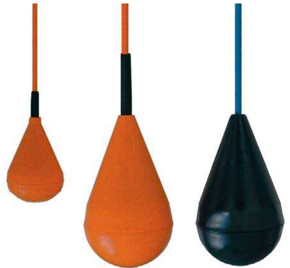
Рис. слева: Модель SLS-M2