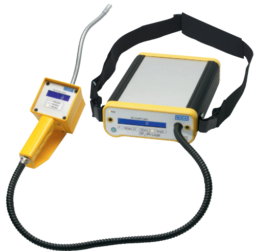
Детектор газов модели GIR-10