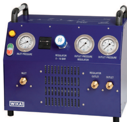
Портативный компрессорный модуль SF 6 тип GTU-10