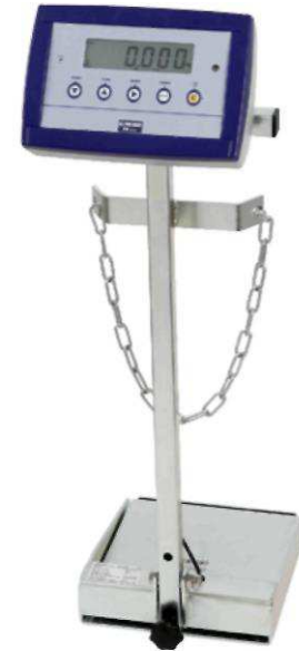
Переносные весы для газового баллона (элегаз SF 6 ), модель GWS-10