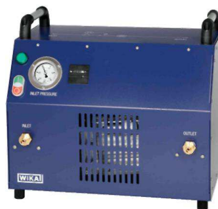
Переносной вакуумный компрессор для элегаза (SF 6 ), модель GVC-10