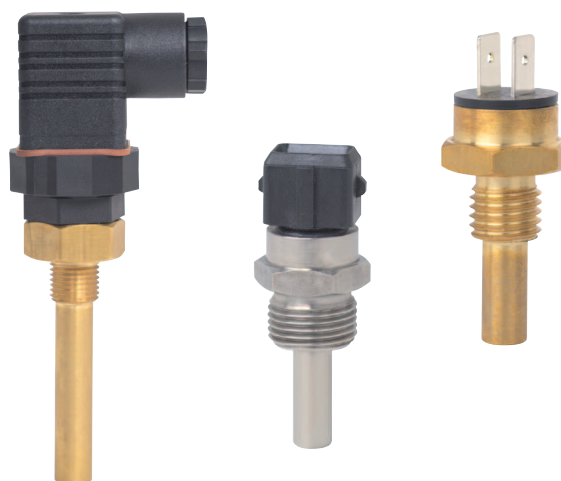
Биметаллический сигнализатор температуры, модель TFS35

Кроме того, биметаллический диск под током может привести к слишком раннему срабатыванию переключателя из-за сильного собственного нагрева.