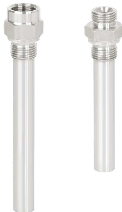
Рис. слева: гильза с резьбовым присоединением, модель TW50-H

Благодаря наличию широкого ассортимента опций конструкций и материалов пользователь может подобрать оптимальный вариант гильзы для специальных условий применения. Выбор гильзы зависит от типа технологического соединения (фланцевое, резьбовое и стерильное соединение) и условий производственного процесса. Основные варианты конструкции представлены резьбовыми, приварными и фланцевыми гильзами.