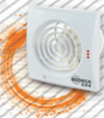
ДЛЯ ЖИЛЫХ ДОМОВ