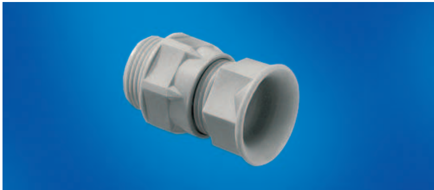
Kabelverschraubungen und Zubehör