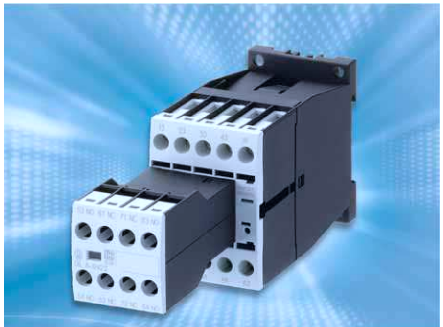
Bild 1: Das Hilfsschütz aus dem neuen Sortiment xStart von Moeller verfügt über 4 Hilfskontakte im Grundgerät. Heute ist es üblich, dass weitere Kontakte (hier 2 oder 4) im Rahmen eines Bausteinsystems, applikationsspezifisch hinzugefügt werden können.

Optimale Fertigungsverfahren sichern heute eine „verschmutzungsfreie“ Produktion der Kontakte und Schalträume. Optimierte Werkstoffpaarungen der beweglichen Teile minimieren den Abrieb über die Lebensdauer und die Kapselung schützt weitgehend gegen äußere, schädigende Einflüsse. Berücksichtigt man zusätzlich die Minimierung der Schaltgeräte-Geometrien, Leistungs-