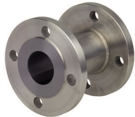
Трубные проточные мембранные разделители для фланцевых соединений, модель 981.27

Манометр или преобразователь приварены напрямую, преобразователь давления с резьбовым переходником