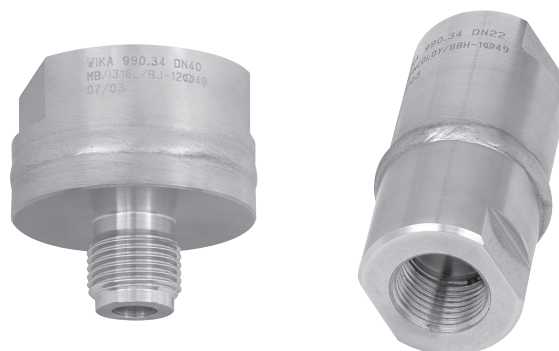
Модель 990.34 Mb 40 мм резьба G 1/2 В (наружная)