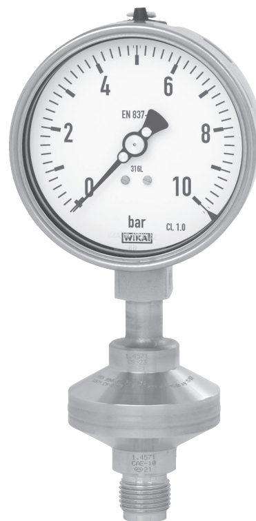
Мембранный разделитель, модель 990.34, Mb 52 мм, резьбовое технологическое соединение G 1/2 В (наружная), с манометром давления, модель 232.50 номин. размер 100

См. также диаграмму давление-температура на стр. 3