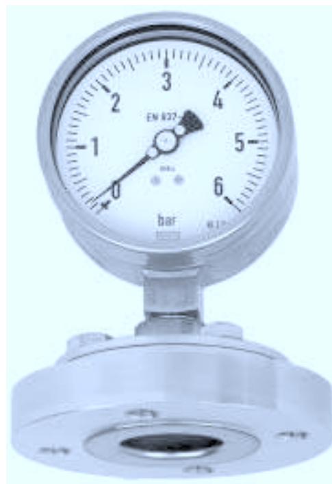
Разделитель, фланцевое присоединение Модель 990.12 с манометром 232.50 HP 100

Проставка, болты и винты: гальванизированная сталь макс. 200 °C