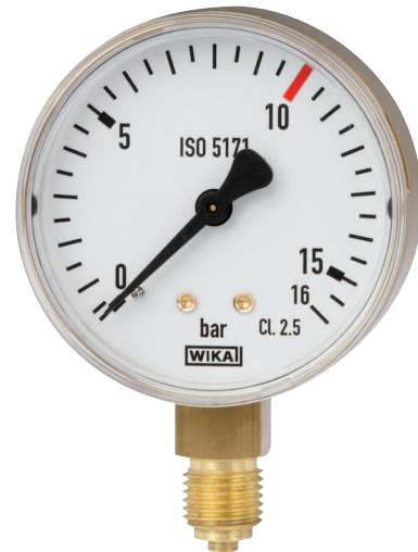
Манометр с трубкой Бурдона модель 111.11