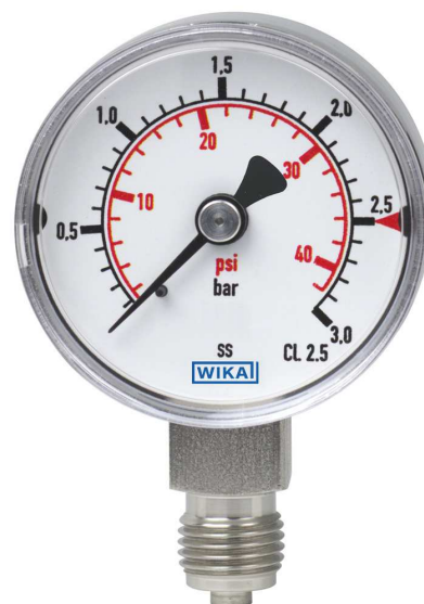
Манометр с трубкой Бурдона модель 131.11.50 со 2-ой шкалой в пси