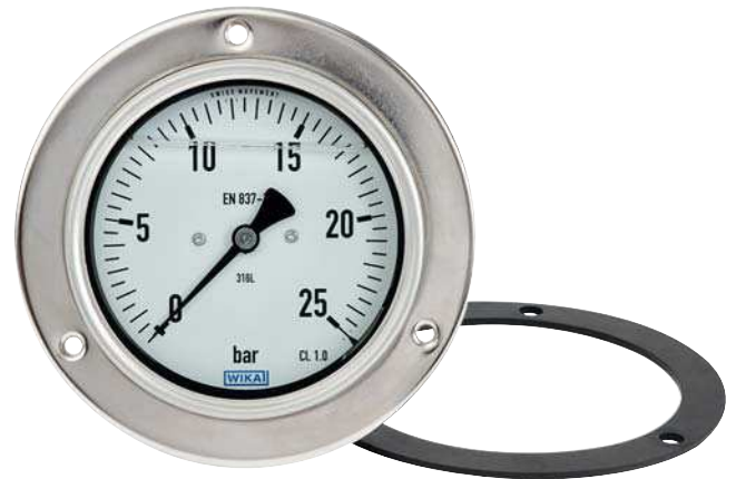
Манометр с трубкой Бурдона модели PG23CP

Высококачественный манометр модели PG23CP предназначен специально для удовлетворения требований, предъявляемых промышленным производством. Данный безопасный манометр используется главным образом в химической и нефтехимической промышленности, газовой и нефтяной промышленности, энергетике, а также в водоподготовке и очистке сточных вод. Обычно точки измерения находятся в блоках управления и на панелях управления, таких как насосные станции (НПУs). Для обеспечения надежного крепления прибора используется высококачественная лицевая панель. Условия монтажа обычно требуют обеспечения пылевлагозащиты IP66. По этой причине уплотнение между манометром модели PG23CP и панелью выполняется с использованием полностью сварного монтажного кольца и соответствующей плоской прокладки.