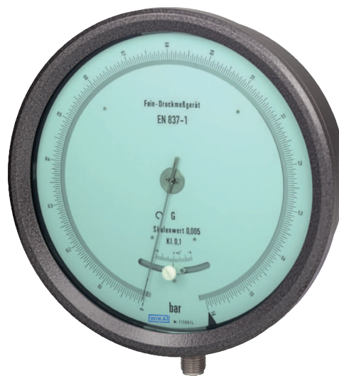
Исполнение тестовых манометров Модель 342.11