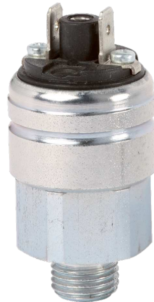
Компактное реле давления, стандартное исполнение, модель PSM06