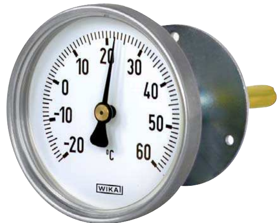
Биметаллический термометр модель А48.10.080