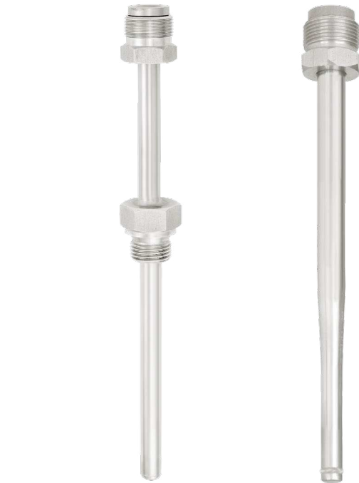
Рис. слева: резьбовая гильза, модель TW35-4 (форма 2G)

Благодаря наличию широкого ассортимента опций конструкций и материалов пользователь может подобрать оптимальный вариант гильзы для специальных условий применения. Выбор гильзы зависит от типа технологического соединения (фланцевое, резьбовое и стерильное соединение) и условий производственного процесса. Основные варианты конструкции представлены резьбовыми, приварными и фланцевыми гильзами.